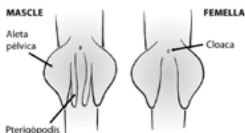
Visión ventral del tiburón macho y del tiburón hembra

Es sencillo diferenciar el sexo de los tiburones ya que los machos tienen dos órganos copuladores externos, los pterigopodios , situados entre las dos aletas ventrales, que hacen la función de pene. La fecundación es interna; es decir, que el macho introduce el esperma dentro de la hembra.