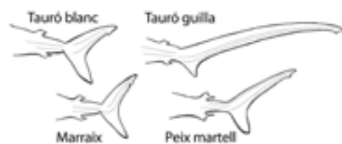
Aletas caudales de algunos tiburones

Los tiburones más rápidos, como los pelágicos (viven a mar abierto,